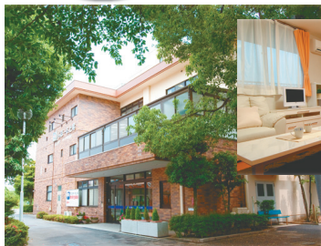
居室の一例(洋室タイプ)