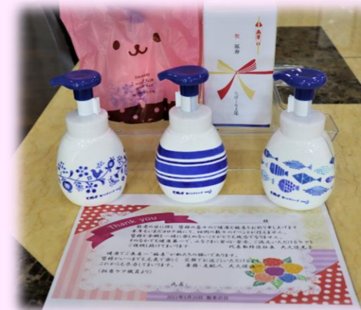
2021年度らぽーる上尾祝福寿祭

これからも、健康第一、楽しい毎日をお過ごしいただきたいと思います。職員一同願っております。